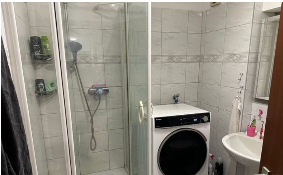
Duschbad mit Waschmaschinenanschluss