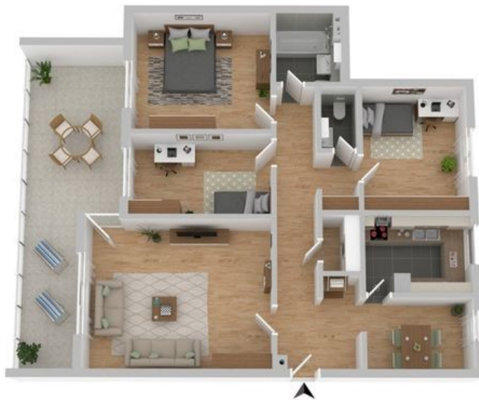
Grundriss (nicht maßstabsgetreu)