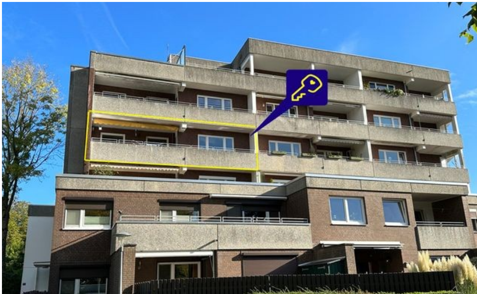
Mitten in Raisdorf