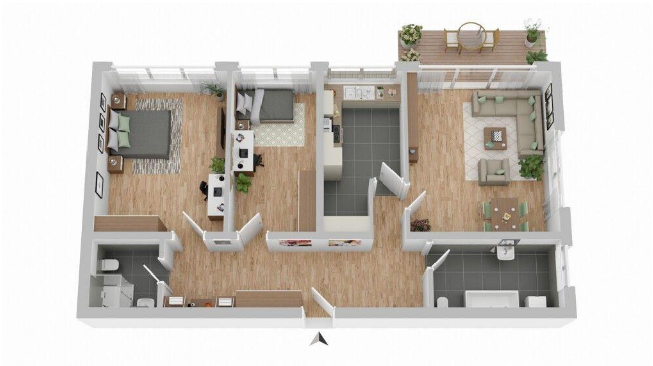
Grundriss (nicht maßstabsgetreu)