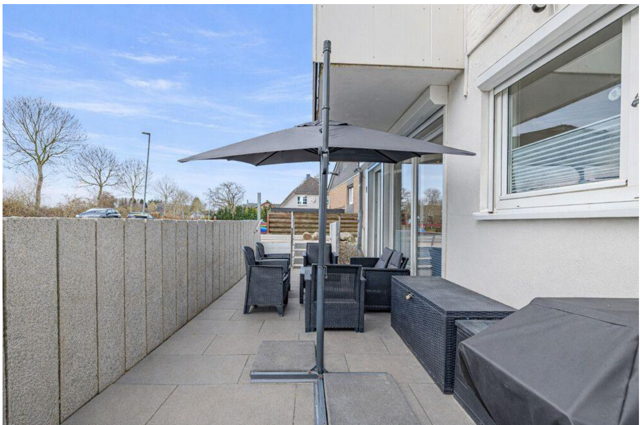
Platz im Freien