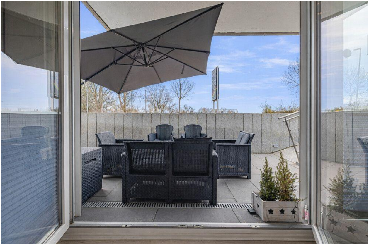
Vom Wohnzimmer aus