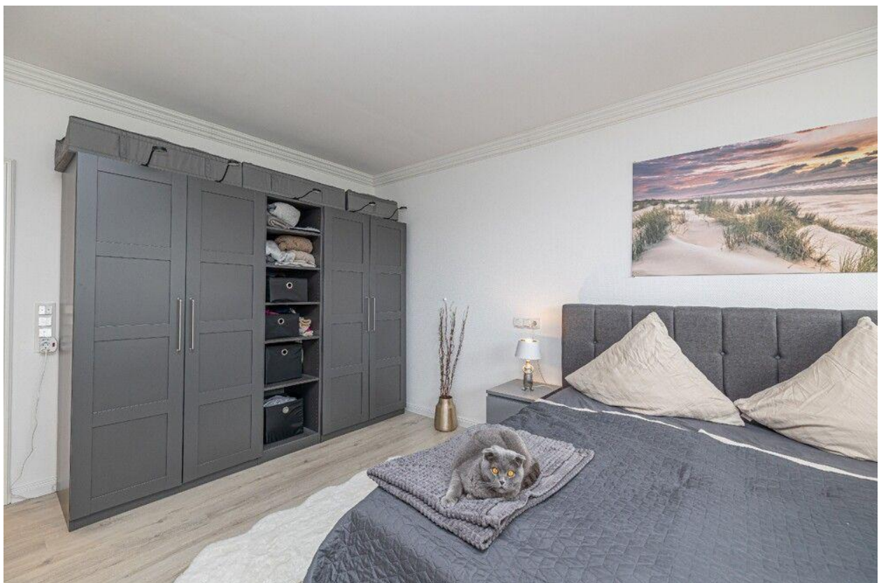
Platz für einen Kleiderschrank