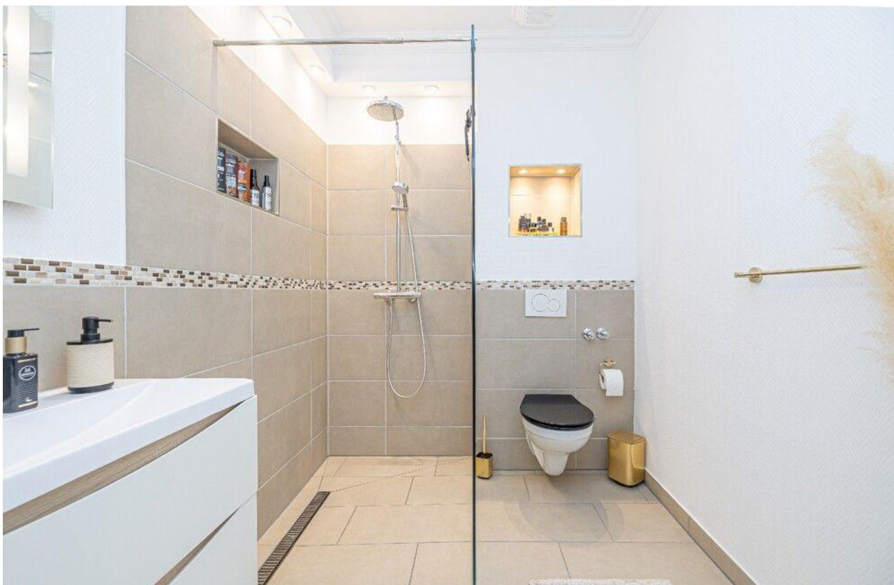
Separates WC mit Dusche