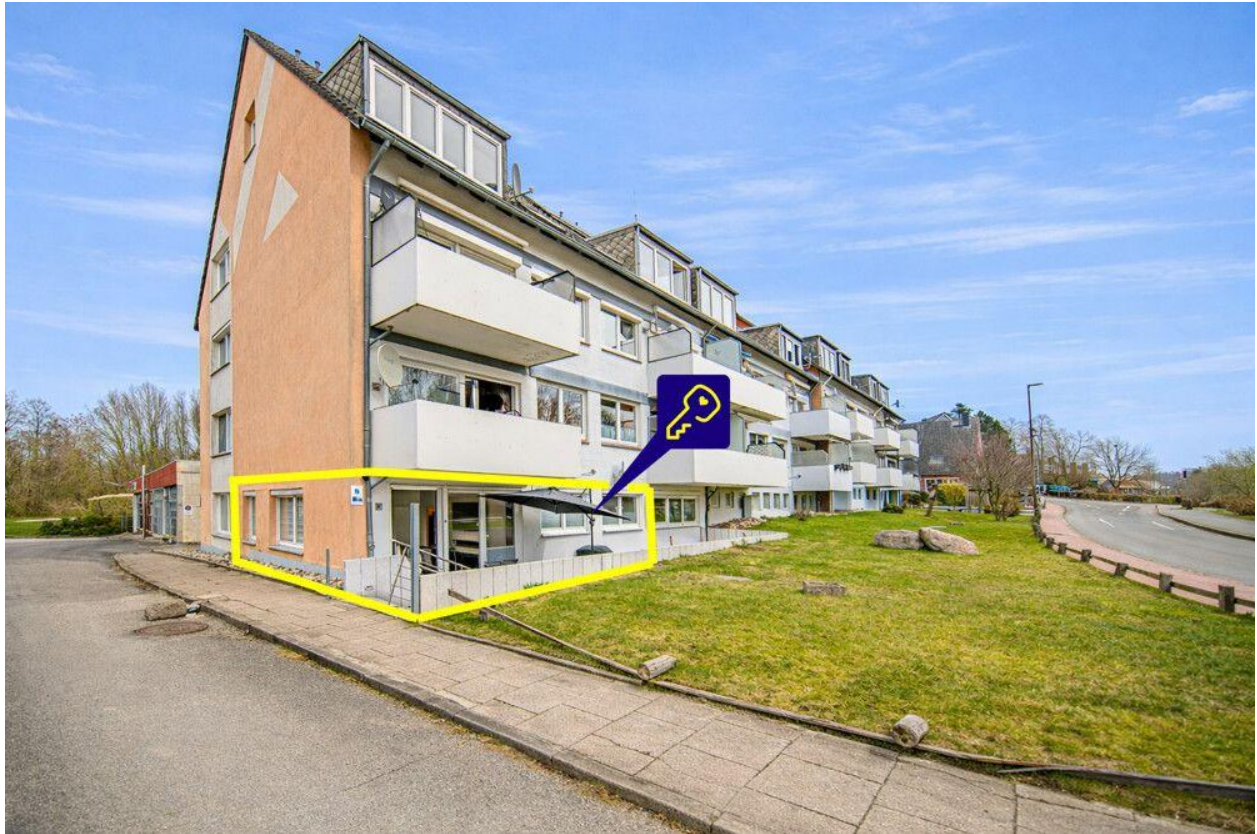
Zentral in Schönberg